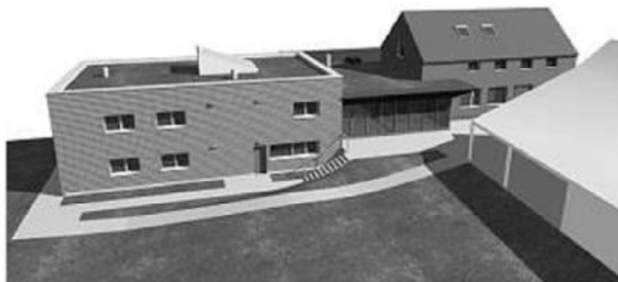
GRAFICKA: HN

Ekologický projekt šetrné osvětlení sa začal realizovať v obci roku 2006, kedy prebehla obnova verejného osvetlenia spočívajúceho v inštalácii najmodernejších svietidiel, ktoré znížili spotrebu elektriny najmenej o štvrtinu. Kúrenie na biomasu spadá tiež do ekologického projektu. Obecná vykurovanie na biomasu od roku 2000 zohrieva takmer celú obec. . V obci je v porovnaní s minulosťou výrazne čistejší vzduch. Medzi ďalšie projekty možno zaradiť bio – muštáreň. V miestnej muštárni sa od roku 2000 vyrábajú jablčné bio- mušty a bylinné bio- sirupy. O dva roky neskôr získal jablčný mušt cenu Česká biopotravina roku 2002.