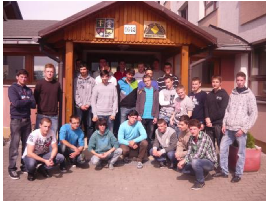
Žiaci 4. A triedy odboru operátor drevárskej a nábytkárskej výroby

Posledný deň v škole strávili naši maturanti v piatok druhom májovom týždni. Lúčili so všetkými zostávajúcimi triedami, ktoré im zaželeli šťastnú voľbu pri ťahaní otázok a úspešné zvládnutie maturitnej skúšky. Celý pedagogický zbor im zaželel efektívne využitý čas v rámci akademického týždňa, zdokonalenie sa v teórii ale aj v praxi.