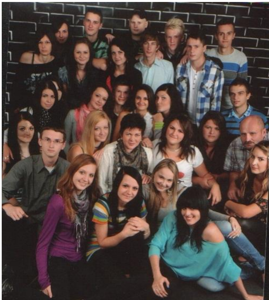
Žiaci 4. O triedy odboru technológia ochrany a tvorby životného prostredia.